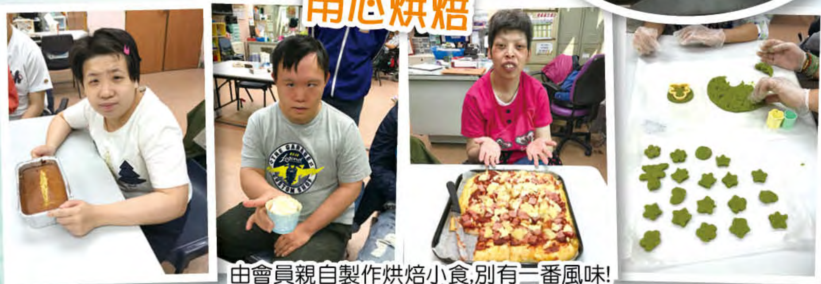
由會員親自製作烘焙小食,別有一番風味!