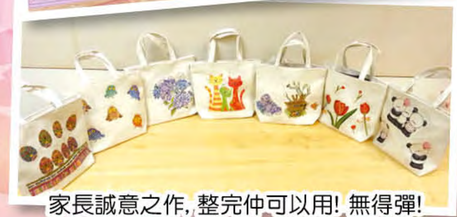
家長誠意之作,整完仲可以用!無得彈!