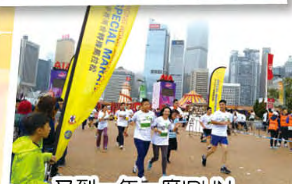
又到一年二度IRUN,今年見唔見到你身影呢?