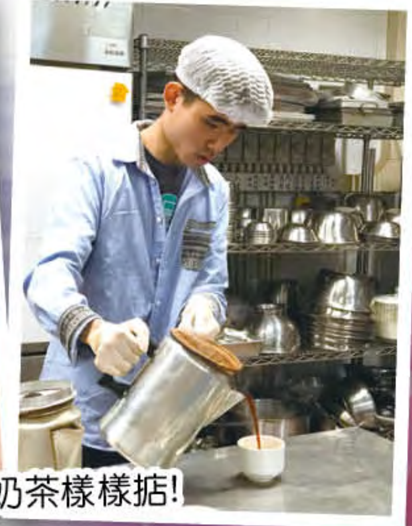
學整茶餐廳小食,熱狗、西多士、奶茶樣樣拈!